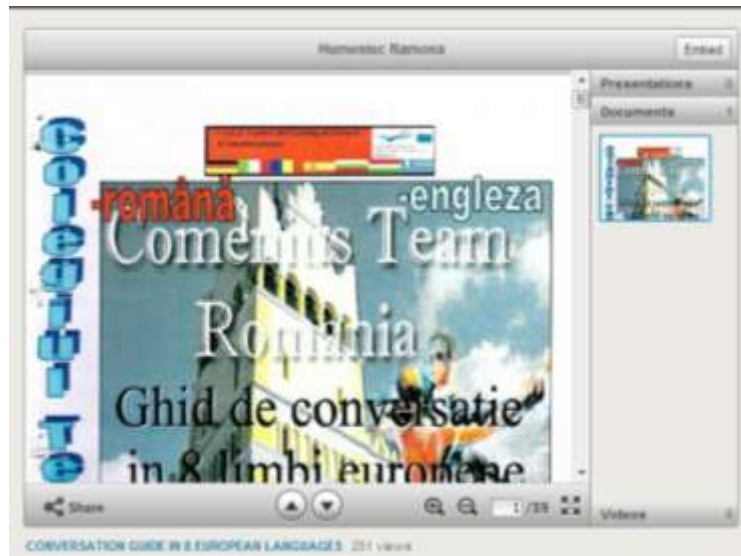
Fig. 6 Captură activități de pe slideshare.net -cont personal

- este cel mai mare instrument on-line gratuit utilizat pentru publicarea de materiale și punerea acestora la dispoziție altor utilizator. Aplicația permite încărcarea prezentărilor în format PowerPoint, documente și foi de calcul, acestea putând fi vizualizate într-un player Flash (fig.6). Utilizatorii pot marca prezentările, le pot descărca sau include (embed) în propriile site-uri sau bloguri.