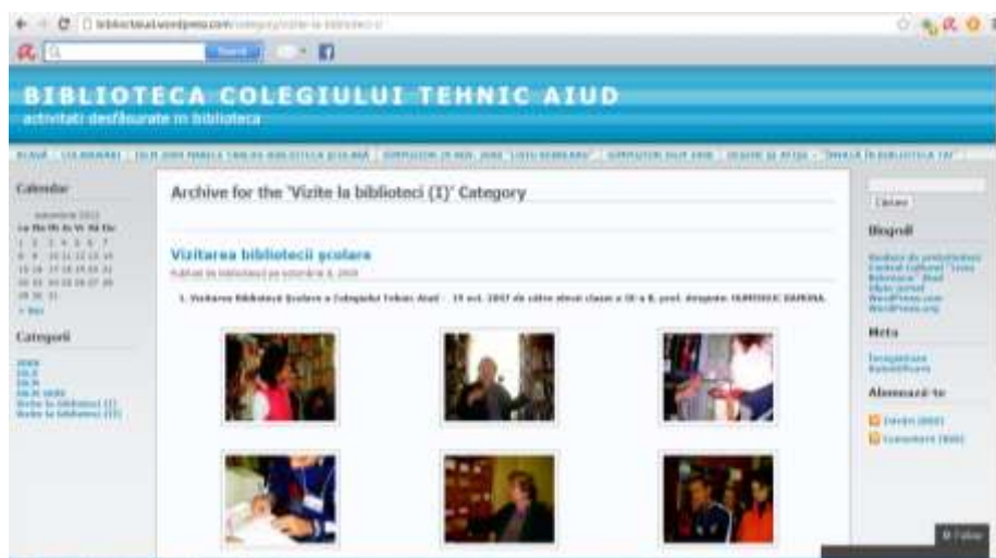
Fig. 1 Blogul Bibliotecii Colegiului Tehnic Aiud- instrument de lucru colaborativ pentru profesori pe platforma Wordpress