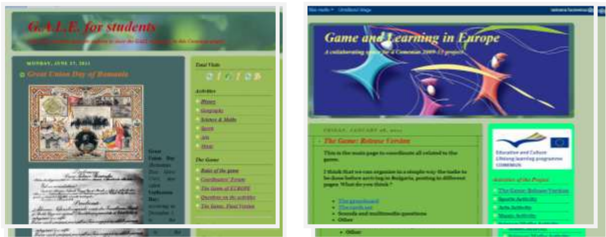
Fig. 2 Blogurile elevilor și profesorilor în proiectul multilateral Comenius G.A.L.E. - pe platforma Blogspot