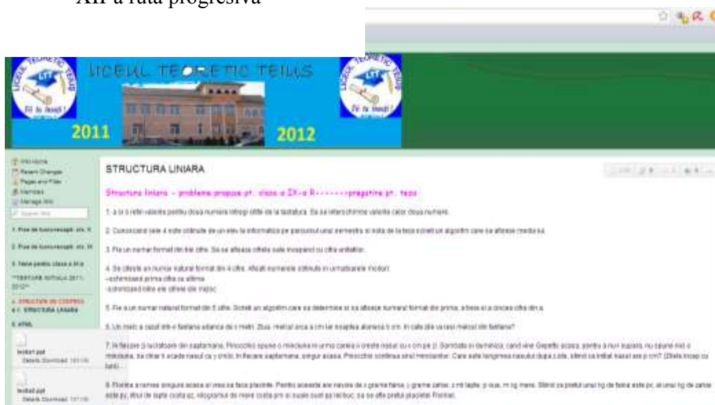
Fig. 5 Wiki pentru activități TIC+Informatică la clasă (cls. IX-XII)