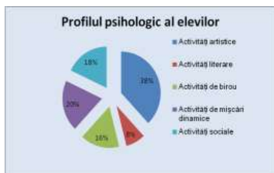
Fig.1. Profilul vocațional al elevilor

Conform Figurii 2 , în școală elevii preferă activități artistice, în proporție de 38% , activități de mișcări dinamice, în proporție de 20% , activități sociale, în proporție de 18% , activități de birou, în proporție de 16% și doar în proporție de 8% prefer activitățile literare. Astfel, la majoritatea elevilor predomină creativitatea, talentul muzical, expresivitatea artistică, ceea ce denotă frumusețe, originalitate, independența și imaginație.